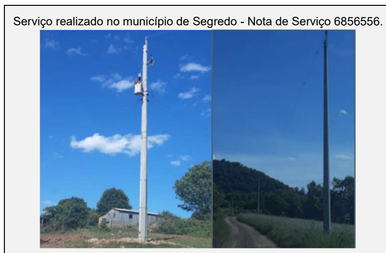
Figura 7 - Registro fotográfico de algumas obras de substituição de postes concluídas no 4º T de 2025.