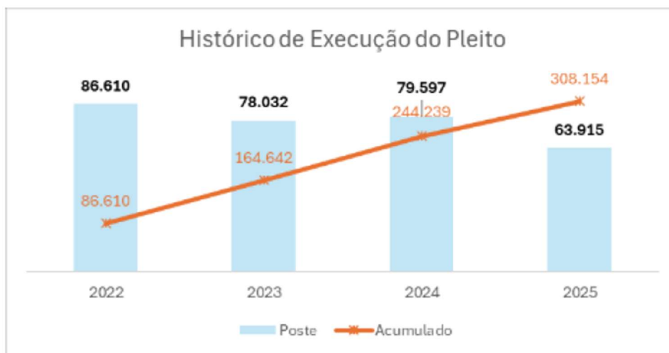
Figura 5 - Gráfico 1 - Histórico de Execução do Pleito.

Nota 1: Total executado até 31 de dezembro de 2025.